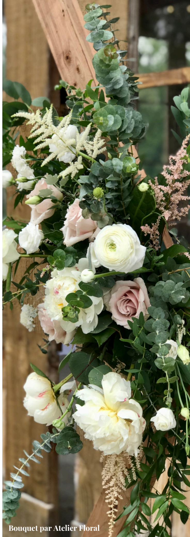
Bouquet par Atelier Floral